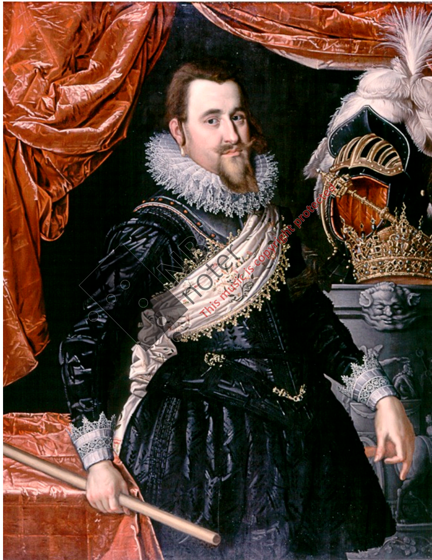
Kong Christian IV av Danmark (1577-1648), bilde malt av Pieter Isaacsz (1611-16)